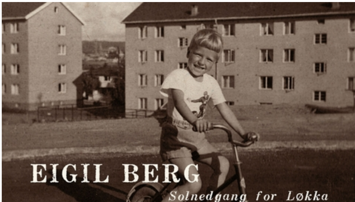
Singlecover til den nye singelen «Solnedgang for Løkka» (2026). Bildet er tatt i Finns vei på Keyserløkka på 1950-tallet.